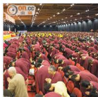
來自世界兩萬八千多個佛教機構代表，向尚無第三世多杰羌佛佛像頂禮。

隨後，覺慧大法師敲響了接受甘露的紫金銅聖鉢，讓大家聞聲接受加持。這個紫金銅鉢乃聖物法器，不久前，祿東贊法王、開初仁波且、貢嘎仁波且主持六大法水匯聚加持“《藉心經說真諦》首發印章”的法會，卻萬萬沒有想到《藉心經說真諦》意外感召聖境顯現，龍天護法突然蒞臨壇場，風雨雷鳴，日光五彩，諸佛、龍天親臨恭賀《藉心經說真諦》經典現世，降下三色甘露，甘露穿透房頂、穿過水晶鉢蓋降於此紫金銅鉢中，以此來證明《藉心經說真諦》是至高無上的真正佛法。大會現場播放了佛陀降下甘露的錄像帶，從修法到降甘露一秒鐘也沒有剪斷過的實況。